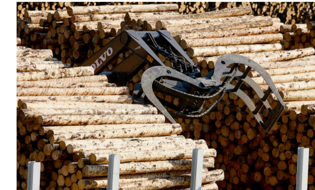
In der Schweiz warten grosse Holz mengen auf ihre Verarbeitung – vielleicht künftig auch im Seeländer Gemüsebauerdorf Müntschemier.